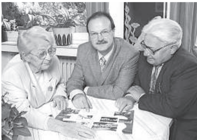
■ Eine gute Beratung kann helfen viel Geld einzusparen.

Außerdem unterscheidet man zwischen den Grundleistungen die im Mietpreis bzw. der Betreuungspauschale enthalten sind, wie z.B. Hausnotruf, Reinigung und Sozialberatung und den so genannten Zusatzleistungen, z.B. ambulante Pflege, Mahlzeiten und hauswirtschaftliche Leistungen wie Zimmerservice. Diese Zusatzleistungen kann der Mieter frei